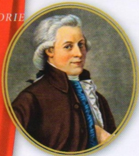
Wolfgang Amadeus Mozart (1756–1791)

Vor 225 Jahren: Uraufführung »Die Zauberflöte«