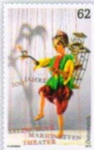
Österreich MiNr. 3051

Zur Popularität des Werkes tragen sicher die Legenden um seine Entstehung bei. Es war die letzte Oper Mozarts, die zu seinen Lebzeiten uraufgeführt wurde. Fakt ist, dass Mozart etwa ab April oder Mai 1791 an dem Werk komponierte. Den Auftrag hatte ihm der Intendant des Freihaustheaters, Emanuel Schikaneder (1751 bis 1812), gegeben. Den Text verfasste Schikaneder selbst. Er übernahm auch die Rolle des Vogelfängers Papageno in der Uraufführung am